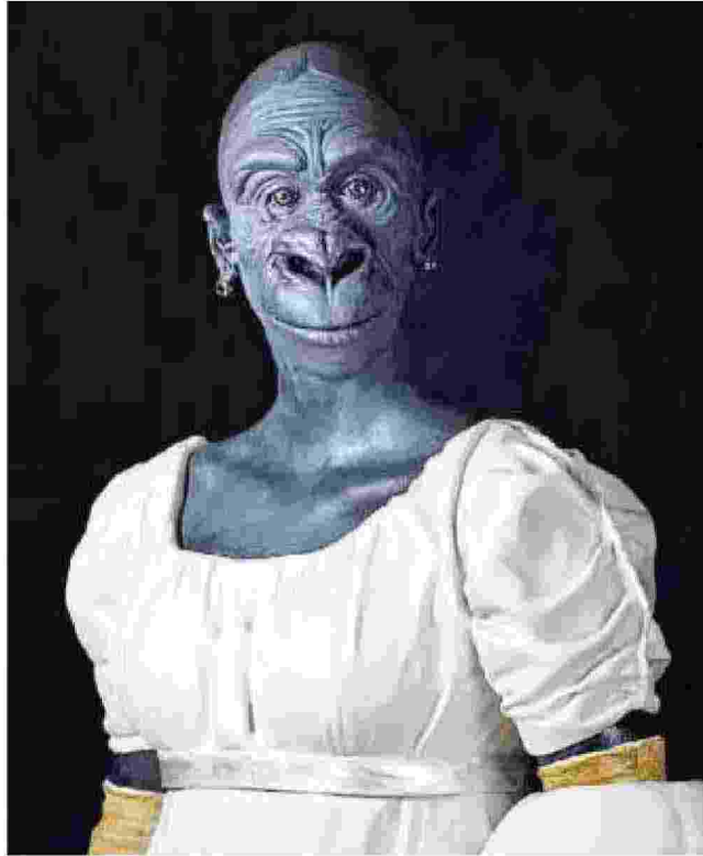
La ragazza col volto di gorilla realizzata da Bertozzi & Casoni